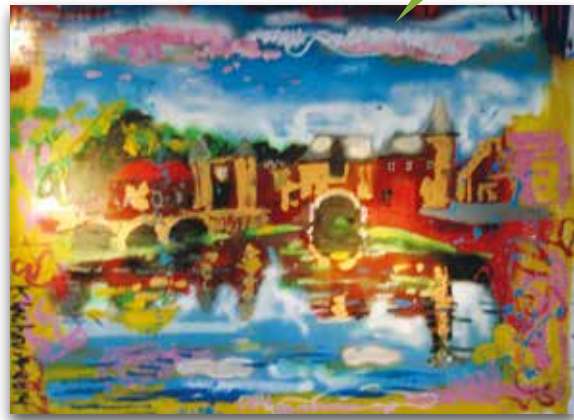
Peter Klashorst - Koppelpoort

Proef de diversiteit is mijn thema. Dit komt tot uiting in het brengen van diversiteit en verscheidenheid in stijlen, in bouwkundig Amersfoort maar ook in doeken die vragen oproepen alsmede doeken waarin windkracht en water een duurzame rol spelen.