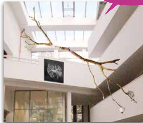
Theo van Delft - Aangeraakt