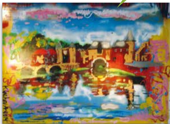
Peter Klashorst - Koppelpoort