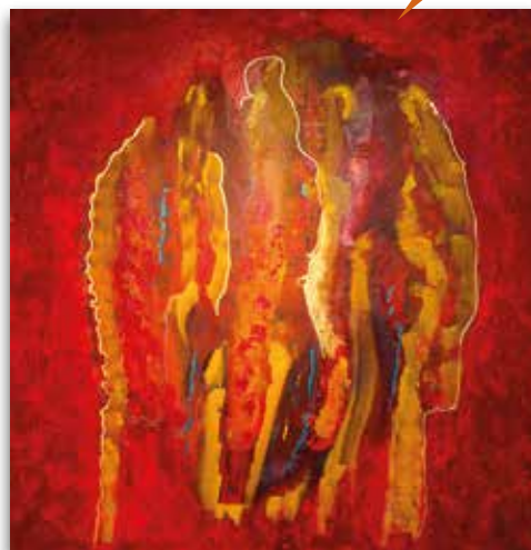
Marijke Vroom-Meijer - zonder titel