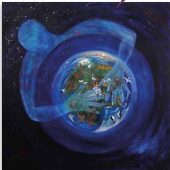
Marijke Visser - Zevende Schepping